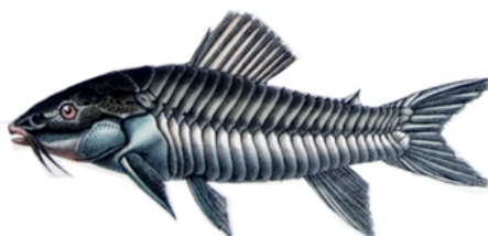
Tamoata (Hoplosternum spp.),