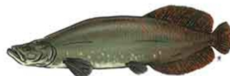
Pirarucu (Arapaima gigas)