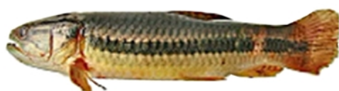
Jeju (Hoplerythrinus unitaeniatus)