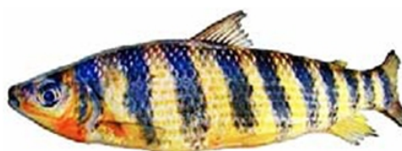
Piau (Leporinus spp.)