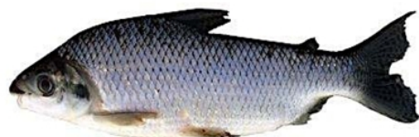
Curimatã (Prochilodus nigricans)