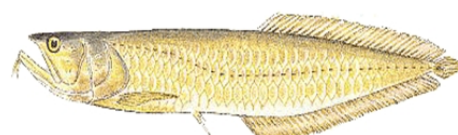
Aruanã (Osteoglossum bicirrhosum)