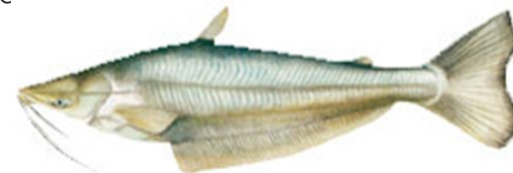
Mapará (Hypophthalmus spp)