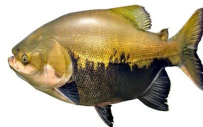
Tambaqui (Colossoma macropomum)