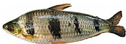
Aracu (Schizodon spp.)