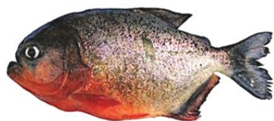
Piranha (Pygocetrus nattereri)