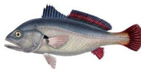
Pescada (Placisnion sauamasissimus)