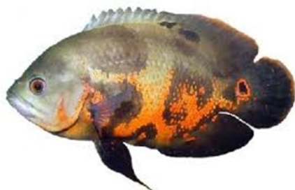
Apaiari (Astronotus ocellatus),