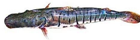
Surubim (Pseudoplatistoma fasciatum)