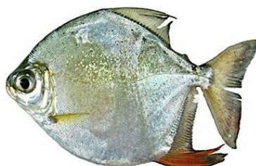
Pacu (Myleus spp.).