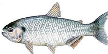
Matrinxa (Brycon cephalus),